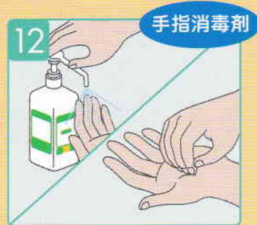
指先からすり込み、全体にのぼす。指の間、親指、手首も忘れずに!