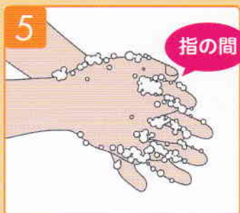
両手の指の間をこすり合わせる。