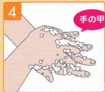
手の甲をもう片方の手のひらでこする。両手行う。