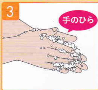
手のひらをこすり合わせ、石けんをよく泡立てる。