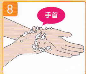
両手首まで丁寧にこする。