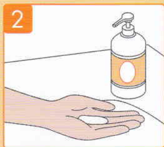
石けん液を適量とる。