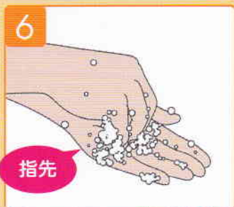
指先でもう片方の手のひらをこする。両手行う。