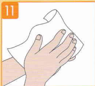
ペーパータオル(ハンドドライヤー)でよく水気を取る。