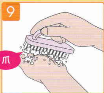
爪ブラシで爪の中を丁寧にこする。