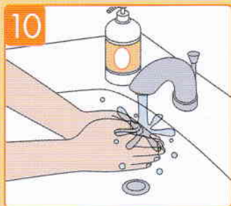
流水でよくすすぐ。