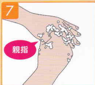
親指をもう片方の手で包みこする。両手行う。